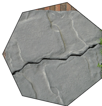
Przykładowe ukształtowanie powierzchni paneli wspinaczkowych